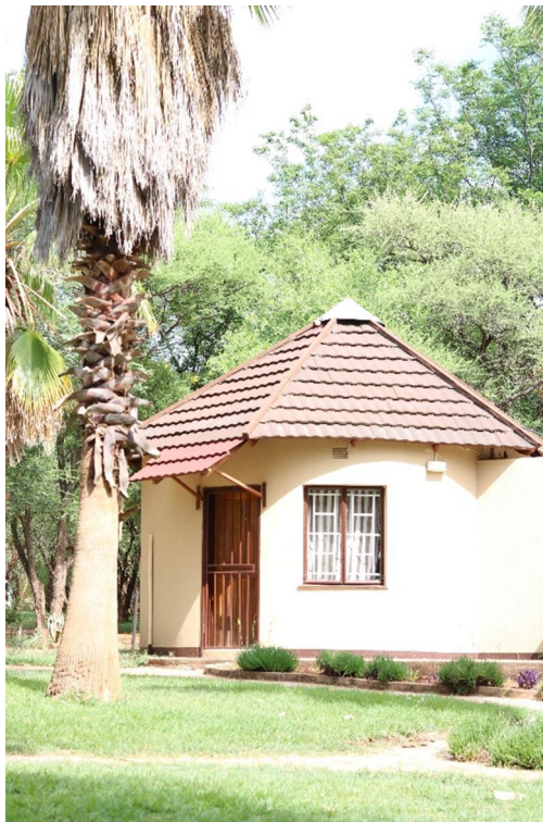
Synodi pidettiin uusiutuvassa Woodpeckerissä.