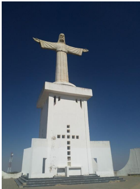
Lubangon Kristus-patsas on 30 metriä korkea valkoinen marmori-patsas, joka on rakennettu vuonna 1957.

Onneksemme ennätimme myös vieraillla Lubangon nähtävyyksillä: Kristus-patsaalla ja Serra da Leballa sekä ihmettelemässä Tundavalan rotkoa. Alla muutama kuva kaupungin nähtävyyksistä.