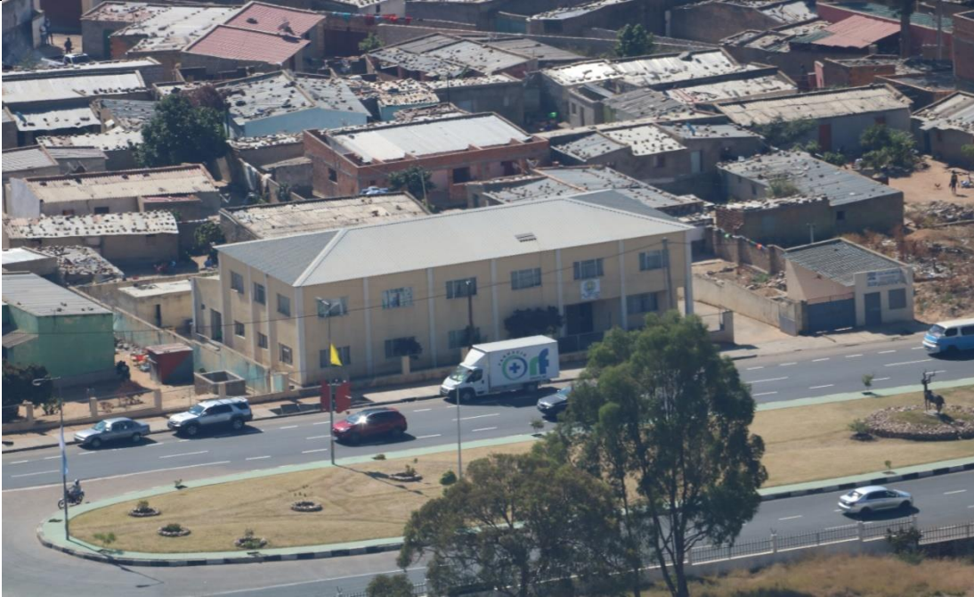
IELA:n pääkonttori Lubangon kuuluisan Kristus-patsaan luota katsottuna.

Onneksemme ennätimme myös vieraillla Lubangon nähtävyyksillä: Kristus-patsaalla ja Serra da Leballa sekä ihmettelemässä Tundavalan rotkoa. Alla muutama kuva kaupungin nähtävyyksistä.