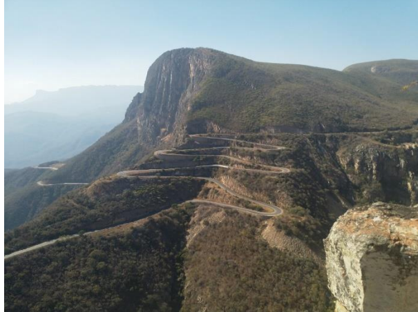
Serra da Leba Pass on sola, jonka korkeus on 1,845 metriä merenpinnan yläpuolelta.