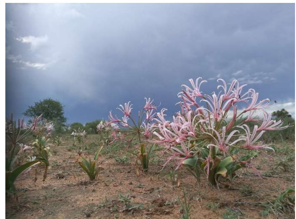
Botswanan luonnosta löytyy Nerine Laticoma.